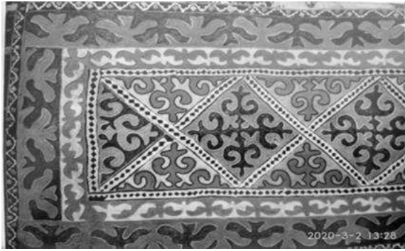
3-сүрөт. Шырдак. Мозаикалык техника