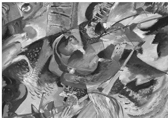
5-сүрөт. В. Кондинский. Композиция

Академиялык живописисте атайын көркөм каражаттар аркылуу аткарылуучу кээ бир эрежелер бар: маанилүүсүн, негизгисин бөлүп көрсөтүп, жардамчыларын экинчилерин ага баш ийдирүү жана фон менен жалпылоо. Ошол сыяктуу музыкада – обондун багыты атайын көрсөтүлгөн ыргак менен башталып, музыкалык өлчөм, бир нече негизги ноталар, андан соң добуш-үн кеңейүүгө өтөт да, оркестр ойноп баштайт. Ошол эле көрүнүш жеке ырчынын акомпоненттин астында аткарылган учурун алып карасак: солисттин үнү хор менен же аспаптардын коштоосу менен толукталган. Дагы бир эң маанилүү сүрөт искусствосу менен музыканы жакындаткан мүнөздөмө бул – контраст. Живописисте салыштыруу иретинде колдонуучулар – түс, көлөм жана масштаб, ал эми музыкада салыштырылуучу нерселер – үндүү темп, бийик жана төмөн ноталар, катуураак жана акырын аткарылуучу добуштар. Мелодия, сүрөтчүнүн боёк сүртүмдөрүндөй, муздак жана жылуу, жарык жана күңүрт келет. Сүрөт искусствосуна берилүүчү мүнөздөмөлөр – тон, нюанс жана биримдик сыяктуу нерселер, музыкада сын берүүдө, критиктердин талкуулоосунда колдонулат.