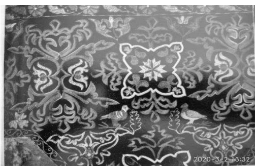
1-сүрөт. Туш кийиз бөлүгү (сайма).

Бул сөз кыргыз элинин кылым карыткан көркөм өнөрү салттуу музыка менен кол өнөрчүлүктүн бири-бирине тиешелүү жагдайлары бар экендигин далилдөөдө. Кыргыз элинин руханий маданиятындагы асыл адаттар сайма саюу, шырдак шыруу, курак куроо иштери, издин энелердин ыр ыргактарынын коштоосунда аткарылып келген. Туш кийизге түшүрүлгөн саймаларда кездештирүүчү ритм, түстүү ноталардай эле алып карасак болот. Ар бир көркөм эмгектин аткарылыш чеберчилиги адамдын жан дүйнөсүн кабыл алуу сезимдерине көз каранды экендигин жогоруда баса белгиленди. Адамзат жаратылыштан эргүү алып көркөм чагылдыруу процессинде пайдаланып келген. Аристотель түстөрдүн сулуулугу жана гармониясын музыкалык добуштардын айкалышы менен баяндаган.