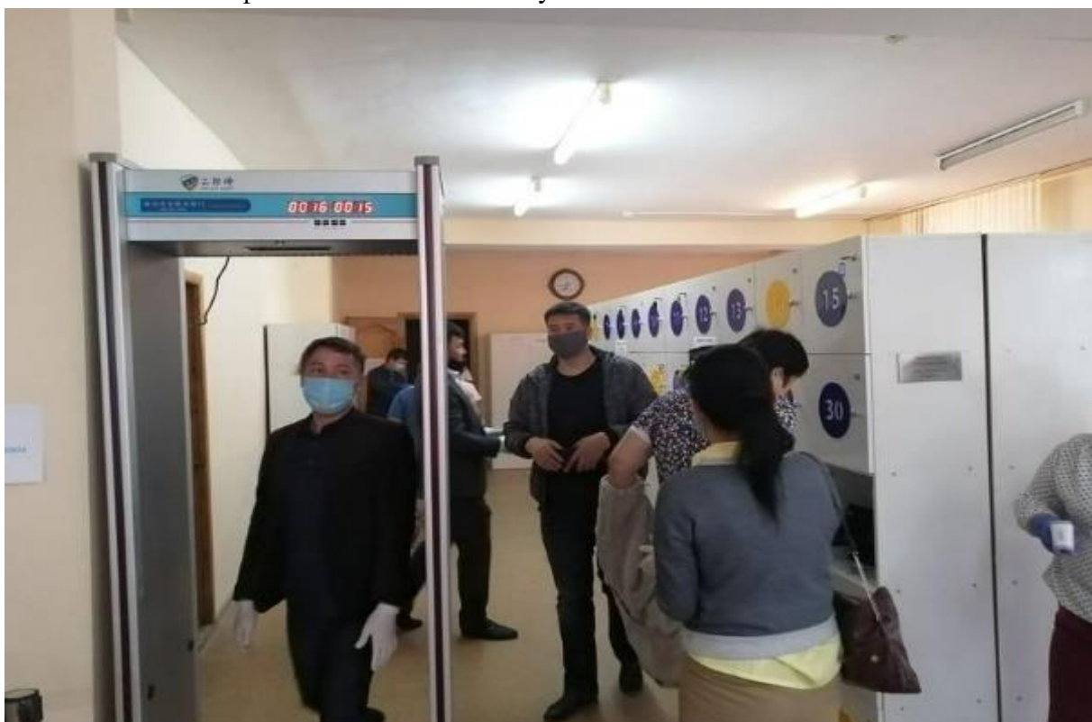
Сдача НКТ в национальном центре тестирования «USNUDY.KZ»

Для прохождения НКТ был создан национальный центр тестирования «USNUDY.KZ» с многочисленными филиалами по всей Республике.