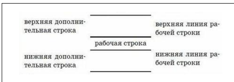
Рис. 1 Рабочая строка, верхняя и нижняя линии рабочей строки.

Для каллиграфического почерка важно соблюдать правила строки. При написании слов любым шрифтом должна соблюдаться высота, наклон, ширина - это три золотых правила каллиграфии: