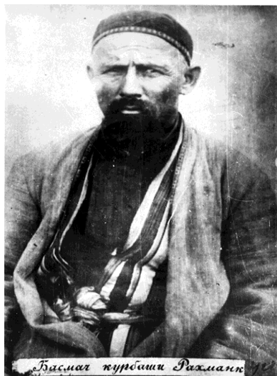
ЦГА КР (0-31089)

Басмачи, курбаши Рахманкул расстрелян в 1922 г.