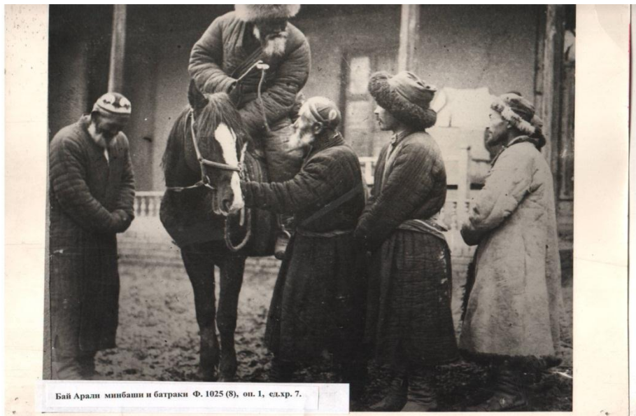
Бай Аралы минбаши и батраки Ф. 1025 (8), оп. 1, ед.хр. 7.

Ошский ОГА КР. Фонд 1025 (8), опись 1, ед.хр. 7.