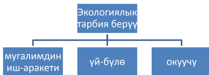
1-сүрөт. Окуучулардын айлана-чөйрөгө жасаган активдүү мамилеси.

Мектеп-лицейинин ата-энелер комитетинин жобосуна ылайык иш пландар түзүлүп, окуучулардын экологиялык маданиятын калыптандыруу максатында иш чаралар жүргүзүлүп, окуучулардын айлана-чөйрөгө жасаган активдүү мамилеси 1-сүрөттө берилди.