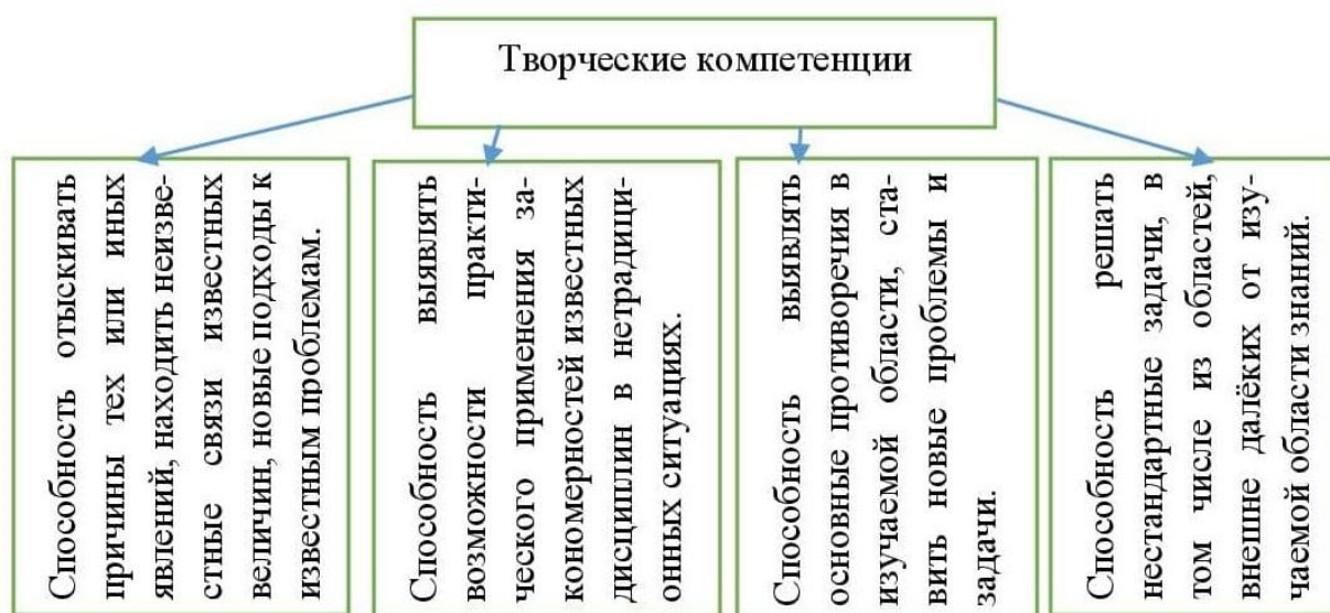
Рис. 1. Перечень способностей творческих компетенций.

Так как начальная школа закладывает фундамент для образования в целом. В этот период развития учащиеся проявляют повышенный интерес к необычному, новому в окружающей среде. Для них характерны пытливость, любознательность, желание фантазировать и размыш- лять, проникать вглубь изучаемого предмета, сопоставляя и сравнивая его с другими, делая свои те или иные выводы.