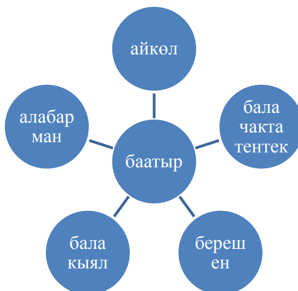
Сүрөт 2. Баатырдык эпостордогу башкы каармандын мүнөздөрүнүн модели.