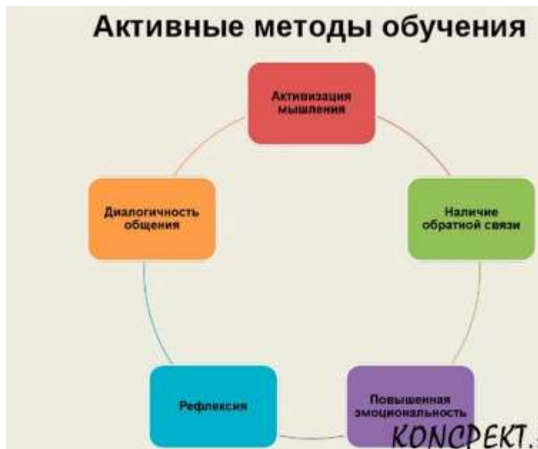
Рисунок 1. Модель активного метода обучения.

Пассивные методы обучения на уроках информатики включают в себя стратегии, где ученики преимущественно получают информацию и знания от учителя или учебных материалов, не активно включаясь в процесс обучения. Вот несколько примеров таких методов: