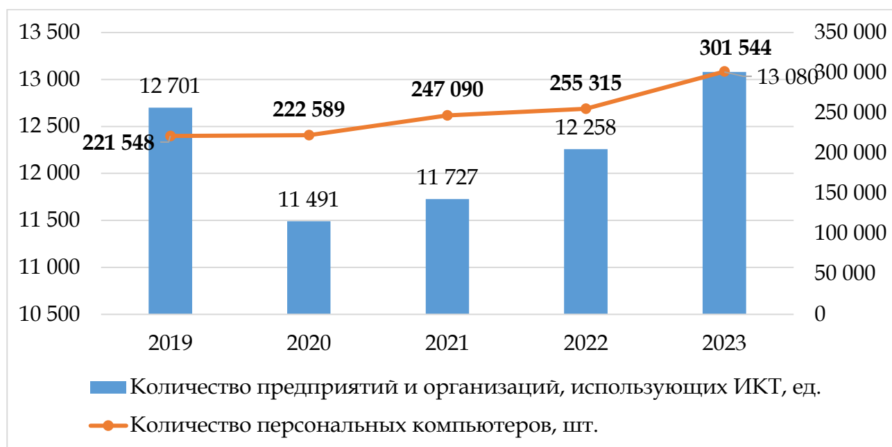
Рисунок 2. Динамика количества предприятий и организаций, использующих ИКТ и числа персональных компьютеров в Кыргызской Республике за 2019-2023 годы

Источник: составлен авторами по данным НСК КР [10]