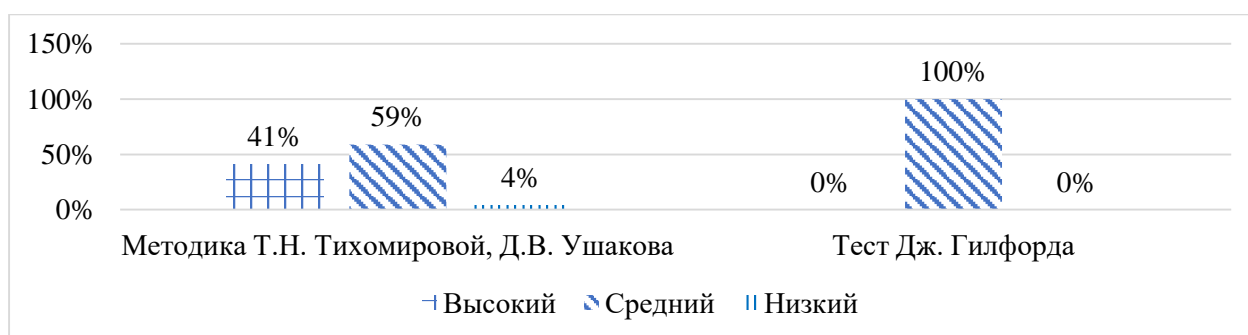
Рис. 3. Уровень развития социального интеллекта у младших школьников по двум методикам (%)

Анализ проведенного этапа дает продемонстрировать общий уровень социального интеллекта младшего школьника по двум методикам: методика «Измерения социального интеллекта у детей младшего школьного возраста (Т.Н. Тихомирова, Д.В. Ушаков)» и тест «Социальный интеллект» Дж. Гилфорда. (Рисунок 3)