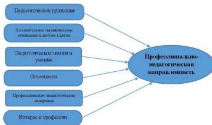
Рисунок 1 – Структура профессионально-педагогической направленности учителя начальных классов

В Республике Казахстан ведется планомерная работа по повышению статуса педагога, привлечению абитуриентов к выбору профессии учителя, вместе с тем, ужесточаются требования к уровню подготовки педагога. На этапе поступления в педагогические вузы ведется отбор сильных, мотивированных обучающихся, поэтому с 2021 года проходной балл единого национального тестирования для поступления в вуз на педагогические специальности составляет 75 баллов. Проводится работа по обновлению образовательных программ, приведение их в соответствие с содержанием обновленного содержания среднего образования.