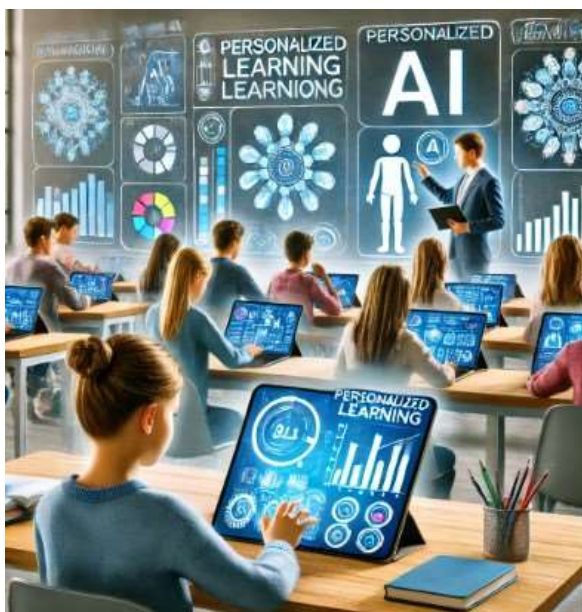
1-сүрөт. Студенттин өзүнчө персоналдаштырылган окуу материалдары менен иштөө процесси.

Ошондой эле окуучулардын прогрессин туруктуу түрдө көзөмөлдөө жана алардын муктаждыктарына жараша окутуу ыкмаларын тез өзгөртүү мүмкүнчүлүгү пайда болот. Бул окуу процессин натыйжалуураак кылып, ар бир окуучунун билим деңгээлин жогорулатууга жардам берет.