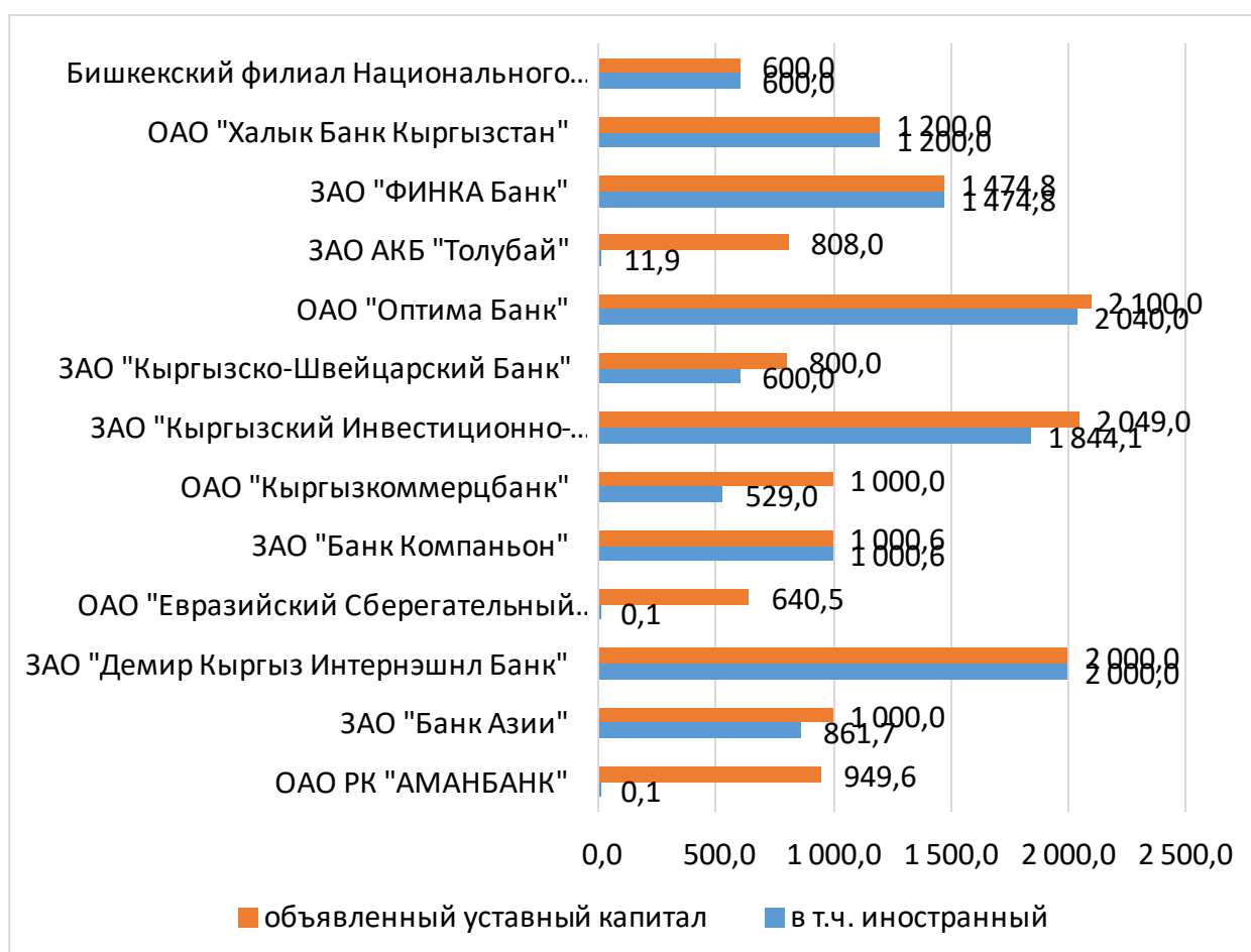
Рисунок 1. Уставный капитал коммерческих банков Кыргызской Республики, имеющих иностранное участие в 2023 году, млн. сомов